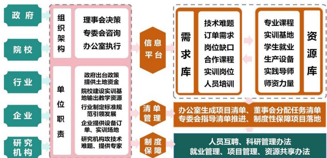
图2 “五方协同、四维驱动” 闭环机制示意图

建立激励保障制度。出台《项目管理办法》等 5 项制度，确保项目落地，强化“需求牵引—资源匹配—清单管理—制度保障”闭环管理。近三年召开决策会议 15 次，累计审定重大事项 38 项，有效推动机制落地生根。