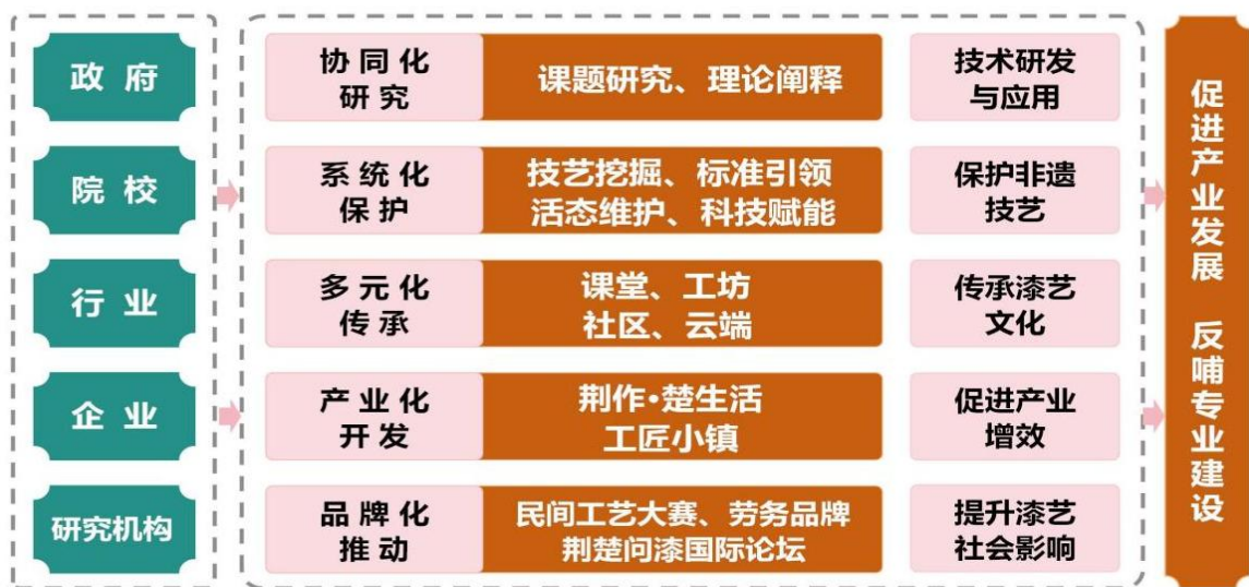
图4 “五化共施、产教互促”发展模式示意图

楚问漆“国际学术论坛；获批省、市级劳务品牌3个，策划研学旅游线路5条，带动漆艺产业年产值增长1.4亿元。