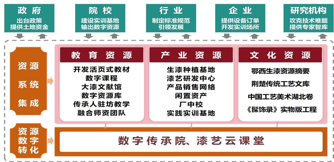
图3 “共建共享、全域整合” 资源平台示意图

谈传承人 100 余名，编撰《鄂西生漆资源辑要》《荆楚传统工艺文库》，通过“漆艺云课堂”实现资源广泛辐射。